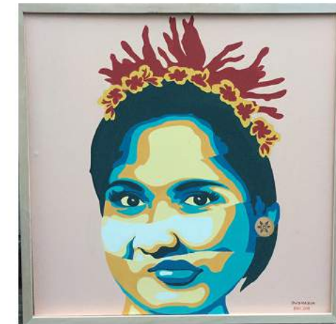
I Wayan Dwima Adinatha "Journey Future" Acrylic on Canvas 60 cm x 60 cm 2019