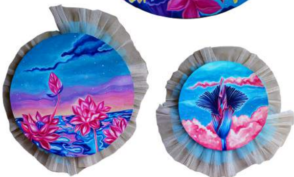
Sandat Wangi "Venus as a Boy" Acrylic on Canvas, Paper & fabrics #1 Diameter 80cm #2 Diameter 38cm #3 Diameter 35cm 2019