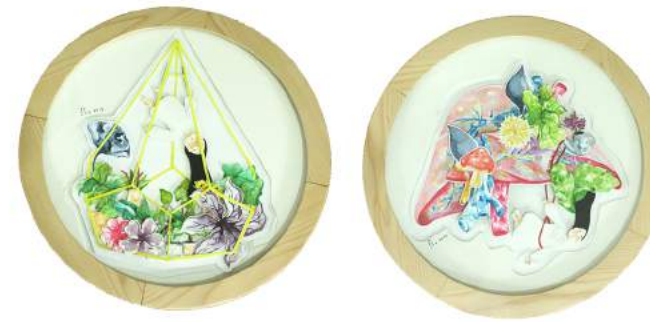
Florentina Arum "Entangled in The Hope of Freedom" Watercolor on Paper (cutting) Diameter 30cm (Round) 30,5cm x 40,5cm (Rectangle) 2019