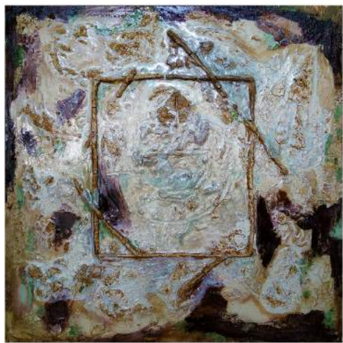
Reza F. Abiyyu "Adhesions" Clay, Color Oxide and Resin on Canvas 100 x 100 cm 2019