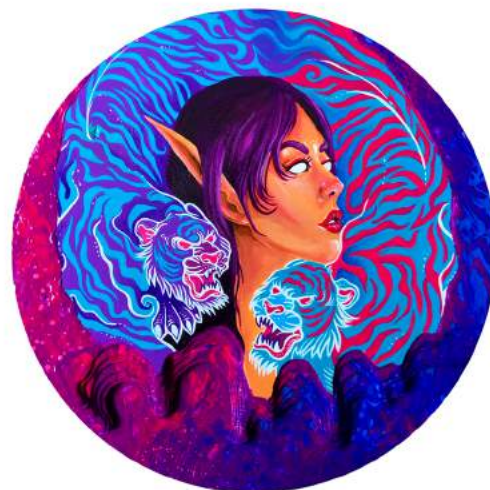
I Putu Yudhi Aditya "Corak Fantasi" Diameter 45cm Acrylic on Wood 2019