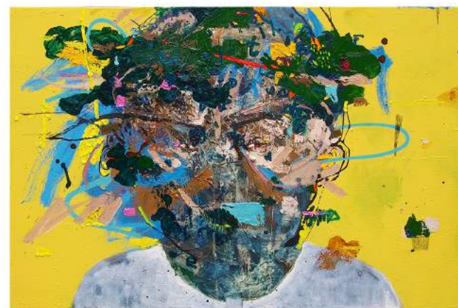
Suyudana Sudewa "Vid" Acrylic, Charcoal, Oil on Canvas 80 x 120 cm 2019