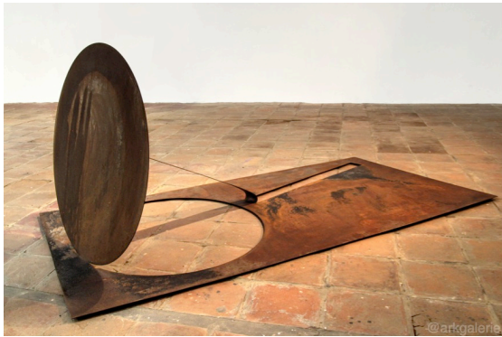
The Unknown of The Familiar No. 5 [2mm Galvanised Steel Plate - Fe weathering, 122x244x98 cm, 2017]