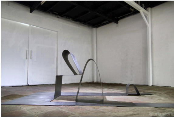
The Unknown of The Familiar No. 1 [3mm Stainless Steel Plate, 122x244x84 cm, 2017]