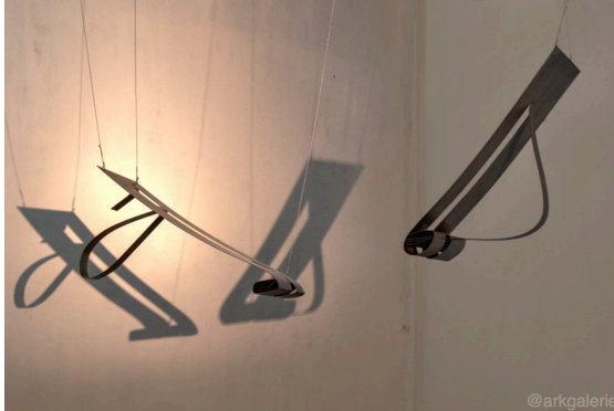
The Unknown of The Familiar No. 3 & No. 4 [3mm Stainless Steel Plate, 61x165x67 cm & 61x147x50 cm, 2017]