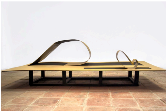
The Unknown of The Familiar No. 2 [3mm Stainless Steel Plate - painted, 122x244x46 cm, 2017]